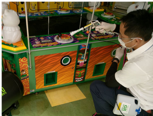
メダルゲーム機 1 台 1 台にコーティング剤の噴霧・塗布を実施