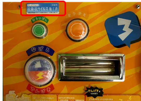
コーティング実施後の機器には施工済マークを貼付

当社は、「お客さま、地域社会の『環境価値』を創造し続けます。」を経営理念に掲げるファシリティマネジメント企業として、引き続き、2020年6月30日にイオンが制定した「イオン新型コロナウイルス防疫プロトコル」を踏まえた防疫対策をお客さまの施設に提案してまいります。防疫対策を一時的な取り組みでなく継続的に実行していくことで、防疫が生活の一部となる社会を実現し、お客さま及び従業員の健康と生活を守り、地域社会に「安全・安心」な施設環境を提供してまいります。