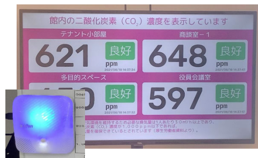
警報付ライト 室内のCO 2 濃度はモニターで確認することが可能

CO 2 センサーにより室内のCO 2 濃度を常時監視、状況に応じて換気量を自動調整するとともに、空調機ごとの稼働状況を集中制御し、空気環境に応じて風量や設定温度を自動的に変更するオープンネットワークシステムを導入。各所のCO 2 濃度と温度・湿度は館内11か所に設置したCO 2 濃度モニターに表示、基準値を超えた場合には警報音とライトの変色、担当者へのメール通知により換気を促します。CO 2 濃度はオフィスアプリにより、従業員のスマートフォンでの確認も可能となる予定です。