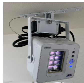
抗ウイルス・除菌用紫外線照射装置

人がいる空間でも使用可能な、抗ウイルス・除菌用紫外線照射装置、Care222® iシリーズを5箇所に設置。紫外線波長222nmを照射し、空気中および人が触れる表面部分の菌やウイルスを常時抑制・除菌します。また、テーブル・椅子などの什器・自動販売機等の人の手が触れやすい場所には抗菌・抗ウイルスコーティング剤の塗布や、抗菌・抗ウイルスフィルムの貼付により、接触表面の感染防止を行っています。