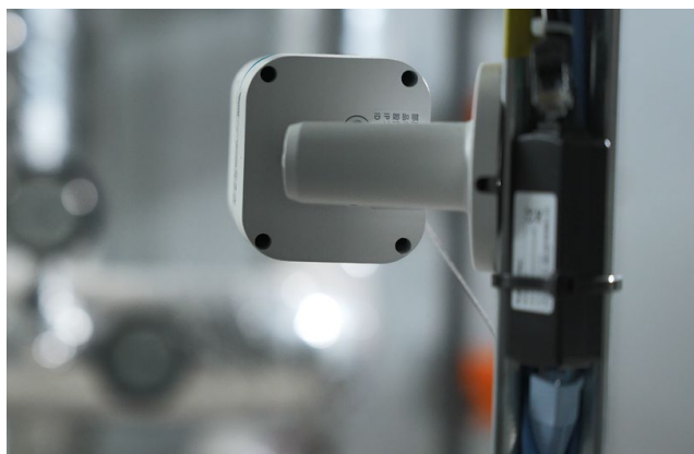
●カメラ（上）やセンサー（下）の活用により施設管理業務をDX