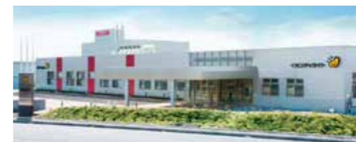
研究・研修施設「イオンディライトアカデミーながはま」

現場環境を再現した実践的な研修・講義から、知識や技術を習得できる施設「イオンディライトアカデミーながはま」を自社グループ内に保有。高い技術の習得だけでなく、お客さまの立場になり「おもてなし」する心も兼ね備えたプロフェッショナル人材を絶えず育成しています。「技術力」と「人間力」で、グローバルレベルのサービス品質を追求しています。