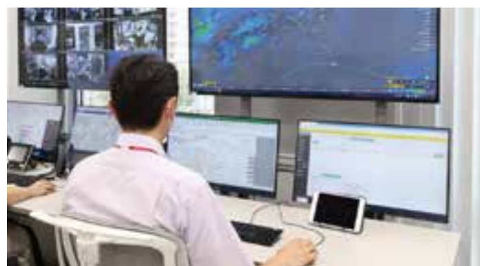
カスタマーサポートセンター (CSC)

CSCによる遠隔サポートと現場業務の省力化を通じて、従来の常駐型個別管理から巡回を主体に複数の施設をエリアで管理するモデルへと移行を進めています。このエリア管理を施設管理における標準仕様としていくことで、人手不足に対応しつつ、専門性を活かしたサービスを提供し続けていきます。