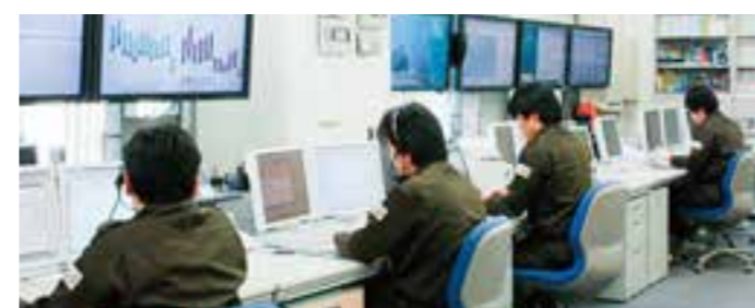
ADソリューションセンター

また、防災レジリエンスの更なる強化を目的に、2021年9月より営業を開始した新本社内にADSCの代替機能を配備。大阪、小牧、東京の3拠点でシステムやデータを共有し、危機管理機能のバックアップ体制を敷くことで、大規模・広域災害にもレジリエンスを発揮できる体制を構築しました。災害発生時には、被災エリアに近い全国8拠点のCSCで迅速な情報収集を行い、ADSCや代替拠点と連携を図りながら、現場の専門性を活かした災害対応で被災地の早期復旧・復興に努めます。