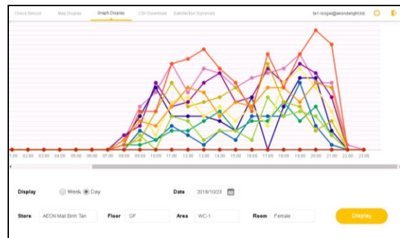
管理者画面（個室トイレの利用頻度）